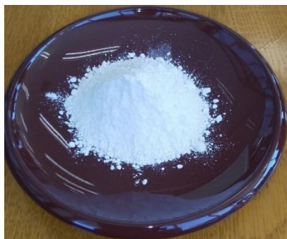
粉碎状態 1.23~3.22 μm