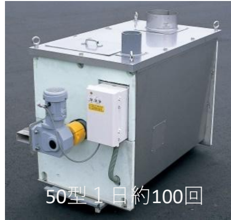
バイオトイレ本体 S型